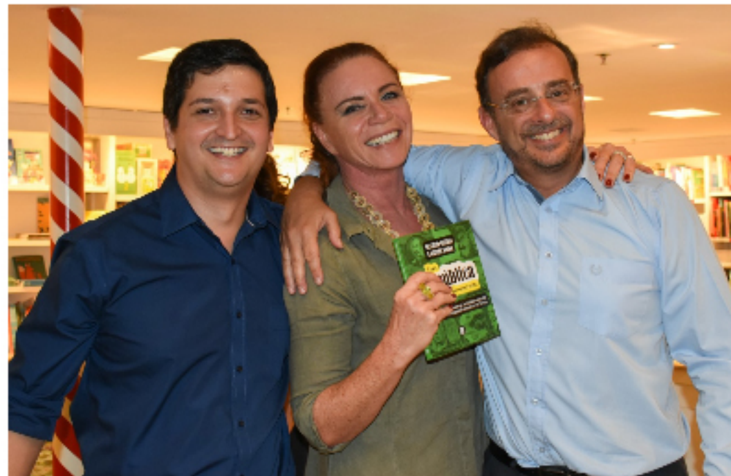
Daniel Sousa, Leilane Neubarth e Octavio Guedes