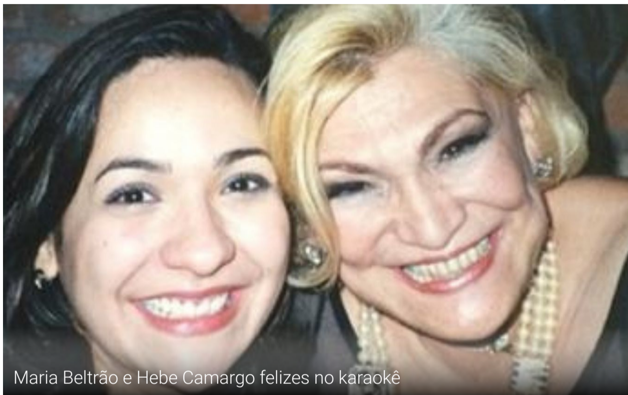
Maria Beltrão e Hebe Camargo felizes no karaokê

"A foto mostra esse momento mágico. Lembro de ter pensado: quem canta com a Hebe, os males espanta. Resisti. Não desisti", escreveu a jornalista em O Amor Não Se Isola .