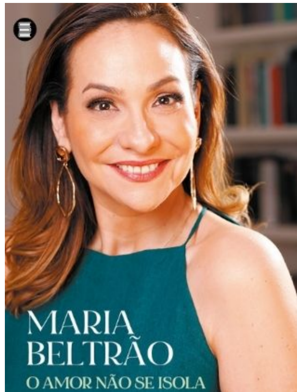
Capa de O Amor Não Se Isola, escrito por Maria Beltrão na quarentena

O Amor Não se Isola: Um Diário com Histórias, Reflexões e Algumas Confidências é da editora Máquina de Livros, tem 128 páginas e o preço sugerido é de R$ 42 para a versão impressa e de R$ 27,90 para o e-book.