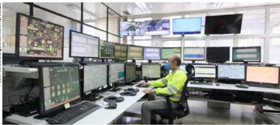
O controle, totalmente integrado, é feito da planta de Pedro Leopoldo/MG, por meio de softwares conectados via Internet.

Um dos benefícios da Operação Remota foi a criação de algoritmos de estimativa da qualidade do cimento que, a partir dos sinais de campo, pode-se prever a qualidade dos produtos,