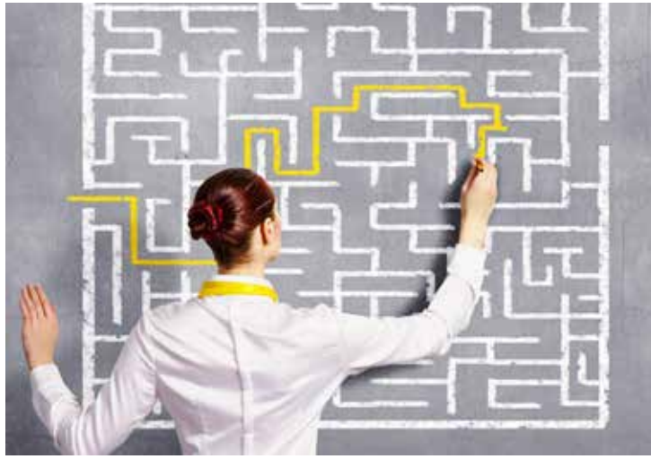
O plano de carreira é determinante para perspectivas mais claras de médio e longo prazo.

Mas como o profissional consegue identificar uma empresa que oferece um